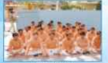
Yoga & Dhyan