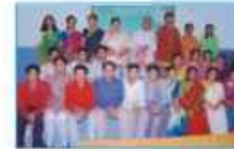
Sanskrit Day Celebration