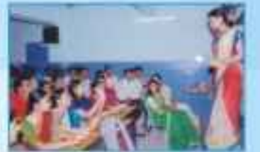
Hindi Day Celebration