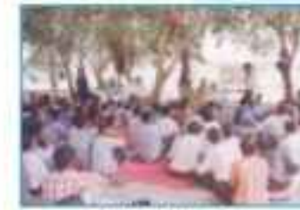
Visit to Rural Area