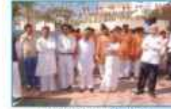
Celebration National Day